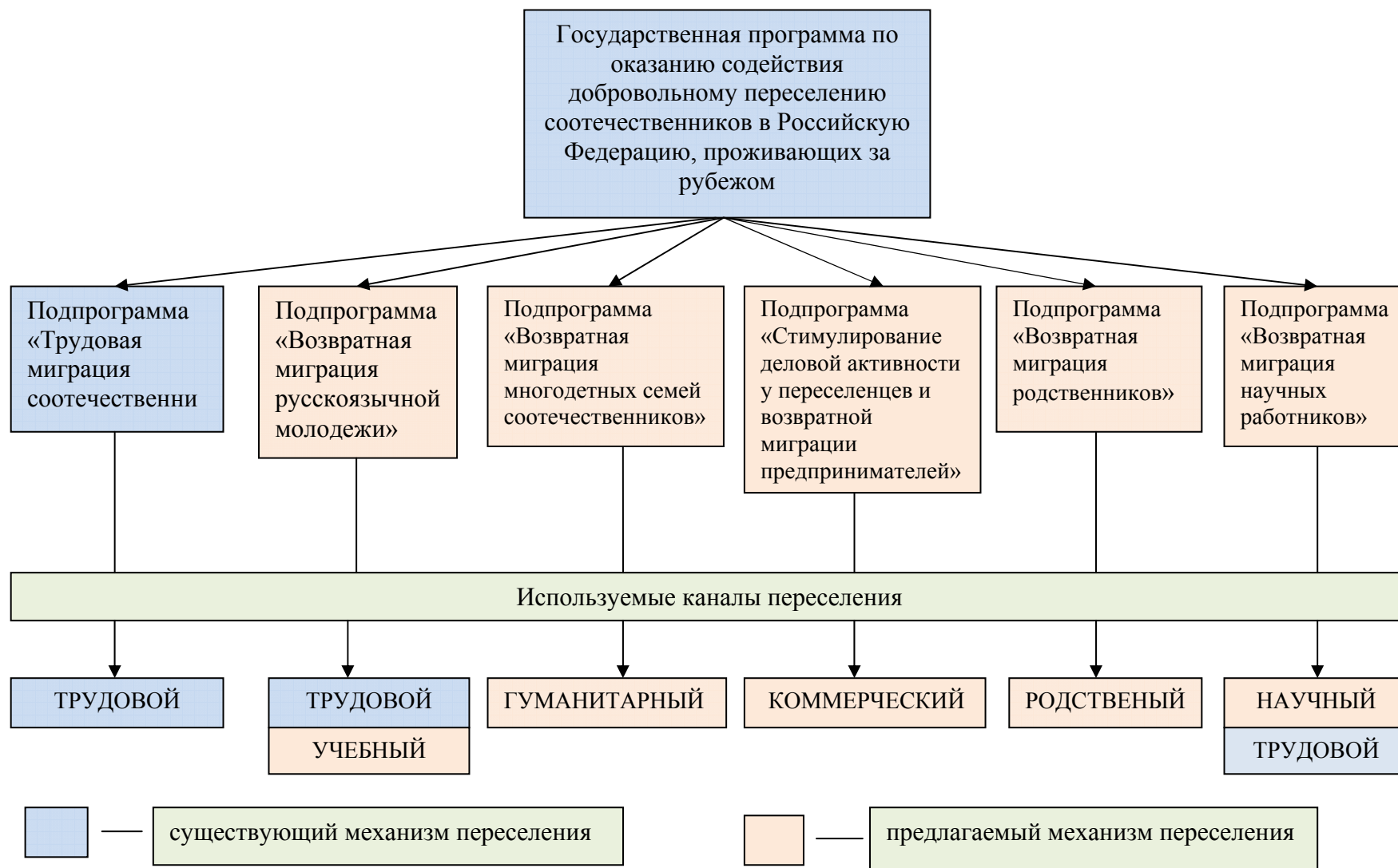
Рисунок 3. Схема новой архитектуры Государственной программы по оказанию содействия добровольному возвращению в РФ соотечественников, проживающих за рубежом.