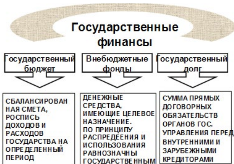
Рис. 3. Государственные финансы

Укрупнено систему государственных финансов можно представить следующим образом (рис. 3):