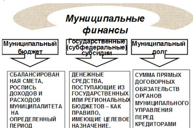
Рис. 6. Муниципальные финансы

Структура бюджета укрупнено выглядит следующим образом (рис. 6):