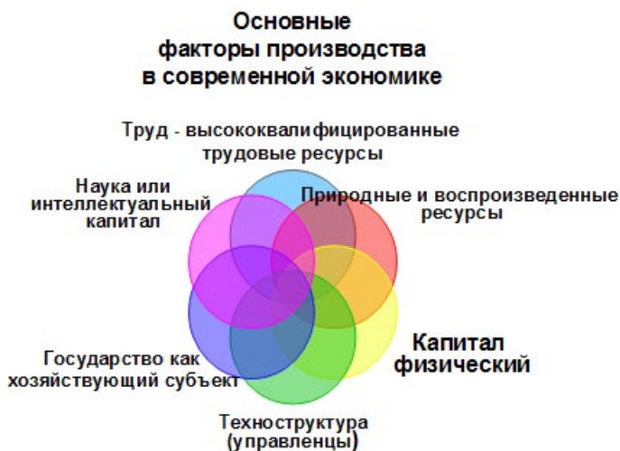
Рис. 7. Основные факторы производства в современной экономике.

Современная экономика – это, прежде всего, инновационная экономика, которая основывается на знаниях. Приоритетное место в ней занимают такие факторы производства как «наука», «человеческий капитал» и природные ресурсы. При этом качественно изменилось само понимание такого фактора производства как «земля (природные ресурсы)». Это в значительной степени связано с изменением самой концепции ограниченности ресурсов в современной экономике. Так решение проблемы ограниченности энергетических ресурсов было найдено в развитии альтернативных источников энергии: увеличение объемов производства биотоплива, использование энергии ветра, солнца, замена традиционных видов топлива и т.п. В тоже время приобретает все более острое значение ограниченность ресурсов первоочередного потребления – пресной воды, чистого воздуха, сохранения комфортной природной среды обитания человека.